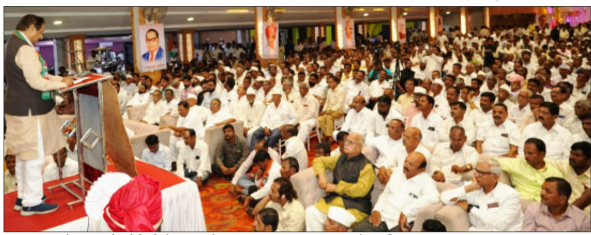
कराड : येथील कार्यकर्ता निर्धार मेळाव्यात बोलताना आ. पृथ्वीराज चव्हाण, समोर उपस्थित जनसमुदाय. ती कामे सुरू होती. ते म्हणाले, गेल्या दहा वर्षात भाजपने द्वेषाचे राजकारण करत सर्वसामान्य जनतेचे मोठे नुकसान केले आहे. आजपर्यंत या लोकांनी विकास खुंटला आहे. अनेक मोठे प्रकल्प

कराड/प्रतिनिधी:- निवडणुकीत पैशाचा वारेमाप वापर होईल. कोणी खोटी आश्वासने देऊन निघून जाईल. पण माझा तुमच्यावर विश्वास आहे. तुमच्या आशीर्वादाने मी खासदार, केंद्रीय मंत्री व मुख्यमंत्री झालो. हे मी कधीच विसरणार नाही. विधानसभा निवडणुकीत प्रत्येकाने आपला बूथ सांभाळावा, व आपला बूथ जिंकावा. राज्यात आघाडीचे सरकार येणार, ही काळ्या दागडावरील खूण आहे. त्यामुळे प्रत्येक गावाचा विकास आराखडा तयार करा. तो पूर्ण करण्यासाठी मी करिविद्ध आहे. कराडचा ऐतिहासिक विकास करण्यासाठी आमहाला साक्ष द्या. आणि पुन्हा कराड दक्षिण मतदारसंघात इतिहास घडवूया, असा निर्धार राज्याचे माजी मुख्यमंत्री आ. पृथ्वीराज चव्हाण यांनी केला. कराड दक्षिण विधानसभा