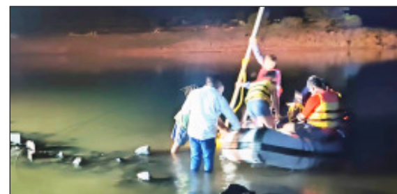
भिलार : अशा पद्धतीने मोहीम राबवूनही जयदीप सापडला नाही (रिवाकत बेलोरो)

घटनास्थळी आले. यावेळी गावातील मुलांनी तलावात उतरून शोध घेण्याचा प्रयत्न केला. परंतु त्यांना यश आले नाही. महाबळेश्वर ट्रेकर्स रेस्क्यू टीमच्या आणि पांचगणीतील एस. ओ. एस. टीमच्या जवानांनी रात्री उशिरा सात वाजता शोध मोहीम सुरू केली परंतु लाईटच्या उजेडात काहीही यश आले नाही. त्यामुळे ही मोहीम रात्री उशिरा थांबवण्यात आली.