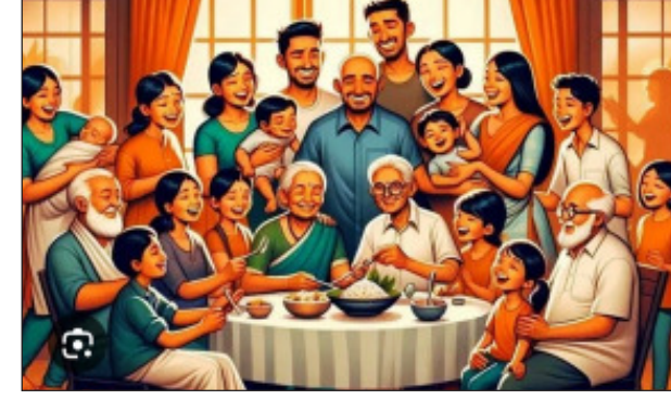
असणाऱ्या परंतु, शत्रूला जाऊन मिळालेल्यांना रक्तातील परके फंदफित्तुरी म्हटले तर वावगे टणणार नाही. थोड्याशा अंतर्गत मतभेदांमुळे नाराज होऊन प्रतिस्पर्ध्यांशी हात मिळवणी करीत त्यांच्या गोटात सामील होऊन स्वकीयांचे, रक्तातील नात्यांचे मानसिक खच्चीकरण, अधःपतन करण्याचे काम हे घरभेदी अविचलित करीत असतात. परंतु, हे सर्व करत असताना नैतिकता, मानवी मूल्ये, नीतिमूल्ये सर्व काही आपण पाहण्याची तुडवणी आहेत याचा पूर्णपणे विस्मर पध्दतीने रक्ताच्या नात्यांमधील दरी अधिकच रुंदावत जाते. जेव्हा बहिणीवर एखादे संकट येते तेव्हा

प्रतिस्पर्धी, शत्रूला सामील झालेल्या अपप्रवृत्तीला फित्तुरी म्हणतात. फित्तुरी विधासघातकी असण्याबरोबरच शत्रूला बळ देणारी उरते. त्यास फंदफित्तुरी असेही संबोधतात. या ठिकाणी फंद हा शब्द गळ्याभोवती आवळलेला फास या अर्थी वापरण्यात आला आहे. या दगाबाज फित्तुरीमुळे प्रसंगी दारुण पराभवाचा देखील सामना करावा लागतो. विशेष करून हे फित्तुरी जर स्वकीय असतील तर मात्र परिस्थितीची दाहकता भयावह अशीच असते.