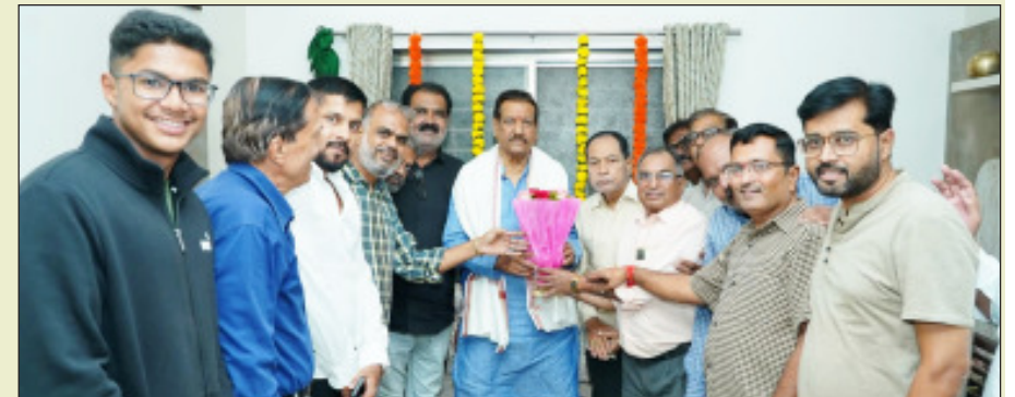
कराड : शहरातील नागरिकांशी थेट संवाद साधत आ. पृथ्वीराज चव्हाण यांनी भावना जाणून घेतल्या. त्यावेळी त्यांचे ठिकठिकाणी उत्कृष्ट स्वागत झाले

एक नागरिक म्हणाले, निवडणुकीच्या तोंडावर एका १०८ कोटी, एका १६ कोटी तर एका २०९ कोटी रुपयांचे विकासकामे मंजूर झाल्याचे पोस्टर लावून केवळ विकासाचा भ्रम निर्माण केला. मात्र पृथ्वीराज बाबांनी हे न करता त्यांनी प्रत्यक्ष विकास केला आहे.