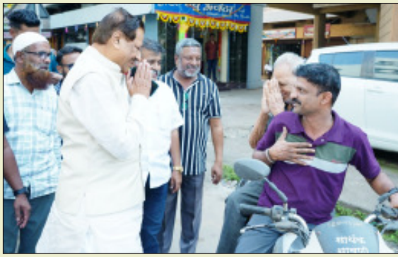
कराड : शहरातील नागरिकांशी संवाद साधताना आ. पृथ्वीराज चव्हाण

कराड दक्षिण विधानसभा मतदारसंघातील राष्ट्रीय काँग्रेस, शरदचंद्र पवार राष्ट्रवादी काँग्रेस व उद्वेग बाळासाहेब ठाकरे शिवसेना व मित्रपक्षांच्या महाविकास आघाडीचे अधिकृत उमेदवार आमदार पृथ्वीराज चव्हाण यांनी कराड शहर व परिसरातील नागरिकांशी संवाद साधला. या भेटीच्या दैन्यात त्यांनी व्यापारी, व्यावसायिक ते थेट नागरिकांच्या घरी जाऊन भेटी देत संवाद साधला. आमदार पृथ्वीराज चव्हाण यांच्या या दैन्यात कराडमधील नागरिकांनी उत्कृष्ट प्रतिसाद देत बाबांना बहुमताने निवडून देण्याचा निर्धार केला. यावेळी शहरातील सुज्ञ नागरिकांनी आपल्या भावना व्यक्त करताना आमदार पृथ्वीराज चव्हाण यांनी केलेला विकास प्रत्यक्ष दृष्ट्याने देत आहोत. मात्र विरोधकांनी विकासाला केवळ पोस्टरबाजी केली आहे. त्यांच्या दोगीपणाला न भुलता पृथ्वीराज