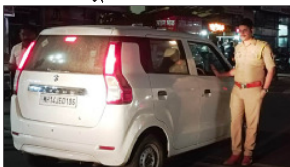
तपासणी विधानसभा निवडणुकीच्या पार्श्वभूमीवर केल्याची माहिती वरिष्ठ पोलीस अधिकाऱ्यांकडून मिळाली. यावेळी वाहन चालकानकडे गाडीची कागदपत्र लायसन्स तसेच पाठीमागे डिक्री मध्ये असणारे सर्व साहित्य पिश्या अन्य तरकारी वाहनांमध्ये सुद्धा तसेच छोटा मोठा चार चाकी वाहनांची सुद्धा कसून तपासणी करण्यात आली. यावेळी या तपासणी दरम्यान

सांगली जिल्हातील खानापूर तालुक्यातील खानापूर आटपाडी आणि विसापूर संकल या मतदारसंघात विटा पोलीसनिरीक्षक पार्श्वभूमीवर करडी नजर ठेवली आहे. या काळात कोणत्याही परिस्थितीत अनुचित प्रकार घडू नये. तसेच विधानसभेच्या निवडणुकीच्या पार्श्वभूमीवर विटा नेवरी नाक्यात अचानक ६ वाजण्याच्या सुमारास विटा पोलीसांचा फौज फाटा अचानक दाखल झाले.