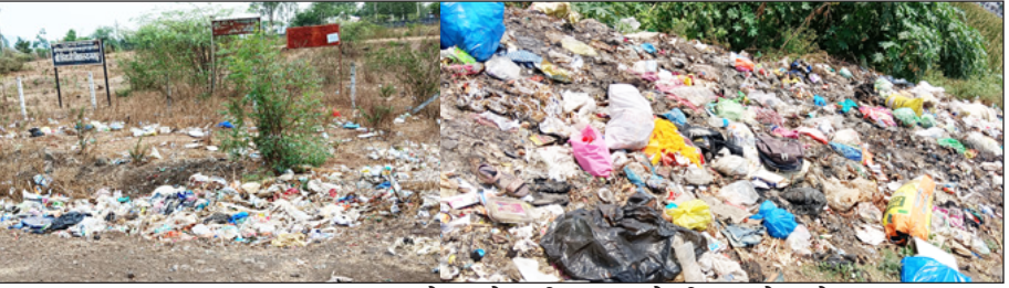
मसूरच्या स्वागत रस्त्याला असे जागोजागी कचऱ्याचे ढीग पडले आहेत.

नजीक पूर्वेला आरफळ कॉलनी रस्त्या नजीक कराड मसूर रस्त्याला मसूरच्या वेशीच्या स्वागत रस्त्याच्या आजूबाजूला काही नागरिक जाणीवपूर्वक दैनंदिन कचरा टाकून घाण करतात सदर कचऱ्यामध्ये चिकन चायनीज व इतर हॉटेल्स मधील खाद्यपदार्थ मोठ्या प्रमाणात वाढतो ते नागरिकांच्या आरोग्यासाठी चिंतेचा विषय झाला आहे मसूरची घंटागाडी संजयनगर माळवाडी नजीक मसूर वस्ती बिरबोबा रस्ता मसूर गावठाण आंबेडकरनगर ब्रह्मगौरी व्यापार पेठ बाजारपेठ असे संपूर्ण गावच्या परिसरातील कचरा संकलित करण्यात येतो तरीही वाधेश्वरच्या तर रस्त्याला ते आरफळ कॉलनी पर्यंत मोठ्या प्रमाणात गाण्याचे साम्राज्य उदभवते आहे मसूर ला दोन घंटागाड्या एक ट्रॅक्टर दिमतीला असताना काही बेफिकीर व विचन संतोषी मंडळी गावच्या मुख्यद्वाराच्या रस्त्याकडेल घाणीचे साम्राज्य करून स्वच्छ व सुंदर मसूर संकल्पनेला गालबोट लावत आहेत ही विचित्र मानसिकता कुठेतरी