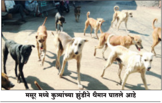
मसूर मध्ये कुत्र्यांच्या झुंडीने धैमान घातले आहे

मसूर/प्रतिनिधी: कराड तालुक्यातील मसूर गावाने स्वच्छ सुंदर आणि आरोग्यदायी मसूर ची संकल्पना खऱ्या अर्थाने सत्यात उतरवली आहे मात्र दोन घंटागाडी असून सुद्धा काही नागरिक मसूरच्या काही भागात विशेषतः वेशीच्या स्वागत द्वारच्या रस्त्याला दैनंदिन कचरा टाकून स्वच्छ सुंदर मसूरला गालबोट लावत मसूरचा चेहरा विद्रूप करण्याची मानसिकता वाढीस लागली आहे ही दुर्दैवी बाब असून यावर कठोर व दंडात्मक निर्बंध कोण घालणार? असा सवाल उपस्थित होत असून या कचर्यामुळे भयान कुत्र्यांची जमात जागोजागी वाढीस लागली आहे ही समस्या मसूरकरांच्यासाठी डोकेदुखी ठरली आहे यावर शासनाची ठोस उपाय योजना असणे गरजेचे आहे अशा खोडसाळ गोष्टीला पायबंद घालण्यासाठी दंडात्मक कारवाईची संकल्पना पुढे आली पाहिजे. अशी मागणी जोर धरून लागली आहे.