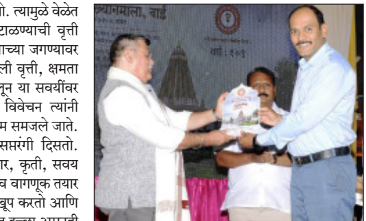
वर्तमानातील गोष्टींप्रमाणे वागत असतो. त्यामुळे वेळेचे काम न करण्याची, कठीण काम टाळण्याची वृत्ती तयार होते. मात्र या सवयीचे माणसाच्या जगण्यावर गंभीर परिणाम होत असतात. आपली वृत्ती, क्षमता व दृष्टिकोण यांची योग्य सांगड घालून या सवयींवर मात कशी करता येते याबाबतचे विवेचन त्यांनी चित्रफितीद्वारे स्पष्ट केले. मन हे प्रिझम समजले जाते. त्यातून परावर्तित होणारा प्रकाश ससंमंरी दिसतो. आपले वर्तन, विश्वास, श्रद्धा, विचार, कृती, सवय या सवयींमिळून माणसाचा स्वभाव व वाणफूस तयार होते. कधी कधी अनावश्यक गोष्टी खूप करतो आणि आवश्यक गोष्टीकडे दुर्लक्ष होते. मनात इच्छा असूनही कृती करता न येणे हा आळस कामातील दिरंगाईस कारणीभूत ठरतो. अनेकदा चांगला मूड येण्याची आणणीत परतु त्यामुळे वैयक्तिक व व्यावसायिक आयुष्यात चांगली संधी चुकते. त्यामुळे ताणतणत निर्माण होतो. वैकल्पिक जीवन जगायला पार पाडते. त्यातून नातेसंबंध व मित्रत्व यांची साखळी तुटते. मोठे आर्थिक नुकसान होते. त्यावर आपली क्षमता व गरज विचारात घेऊन कोणत्याही कामाला प्राधान्य देणे. हाती