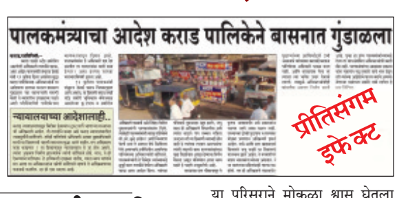
या परिसराने मोकळा श्वास घेतला आहे. गेल्या अनेक दिवसांपासून शहरातील बस स्थानक परिसरात मोठ्या प्रमाणात अतिक्रमणे वाढली होती. याबाबत संबंधितांना नगरपालिका प्रशासनाने अनेकदा नोटीसा बजावून अतिक्रमणे स्वतःहून काढून घेण्याचे आवाहन केले होते. मात्र, त्याकाड संबंधित व्यावसायिकांनी दुर्लक्ष केले. या अतिक्रमणामुळे वाहतुकीला मोठ्या प्रमाणात अडथळा होईल, अशा पद्धतीने व्यवसायिकांनी ही दुकाने, हातगाडे, खोकी थाटली होती. बस स्थानकाच्या आतील बाजूसही शनी मंदिराजवळ मोठ्या प्रमाणात

येथील नगरपालिकेच्या बांधकाम आणि आरोग्य विभागाने शहरात बुधवारी सायंकाळी अतिक्रमण हटाव मोहीम राबवली. यामध्ये प्रामुख्याने बस स्थानक परिसरातील सिग्नलवर भूविकास बँक परिसरातील अतिक्रमणांवर हातोडा टाकण्यात आला. यामध्ये अनेक हातगाडे, खोकी, दुकाने हटवण्यात आली असून,