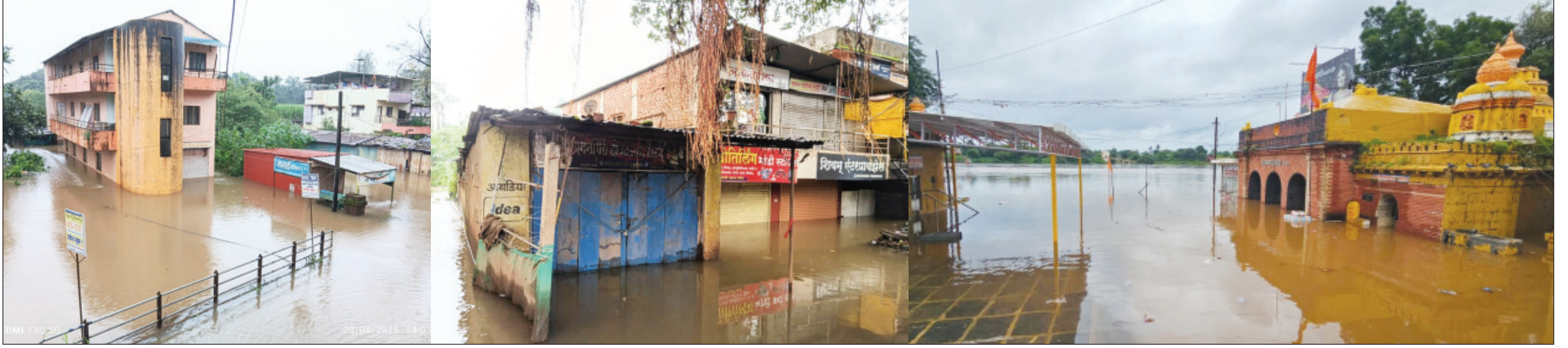
पाटण येथे मुळगाव रस्ता, स्मशानभूमी परिसर, नवीन स्टॅण्ड परिसरात पाणी आल्याने अनेक घरे, दुकाने पाण्याखाली गेली आहेत. (छाया-एस.मोहिते) तर तीसऱ्या छायाचित्रात प्रीतिसंगमावरील कृष्णामाई मंदीरात पाणी शिरल्याचे दिसत आहे. (छाया-अस्लम मुल्ला)

वर्ष २९ वे अंक ११२ पाने ६ गुरुवार दि. २१ ऑगस्ट २०२५ किंमत २ रूपये R.N.I.No.MAHMAR./2001/10338 पोस्ट परवाना No./KRDDN/008/2024-2026 फोन-२२७७२५