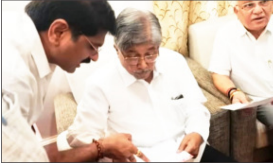
संदर्भात गैरसोय लक्षात घेता भाजपचे बस स्थानकातील गैरसोईवर मार्ग ठरविताना पालकमंत्री यांनी विटा काढण्यासाठी सांगली जिल्हाचे पालक

खानापूर तालुक्यातील विटा शहरातील विटा आगार डेपोचे नवीन बस स्थानक बनवण्याचे काम जवळपास एक वर्षे झाले सुरू आहे. परंतु जुने विटा बस स्थानक पाडत असताना प्रवाशांच्या बाबत कुठली सुविधा उपलब्ध किंवा प्रवाशांच्यासाठी कोणती न करता जुने बस स्थानक पाडून नव्या बस स्थानकाचे काम गेले वर्षभर सुरू आहे. विटा बस स्थानक बाबत प्रवासी व नागरिकांतून तीव्र नाराजी दिसून येत होती. तसेच लवकरच आपण विटा बस स्थानक या संदर्भात पालकमंत्री यांचे भेट घेणार असल्याचेही सांगितले होते. त्या अनुषंगाने विटा बस स्थानक