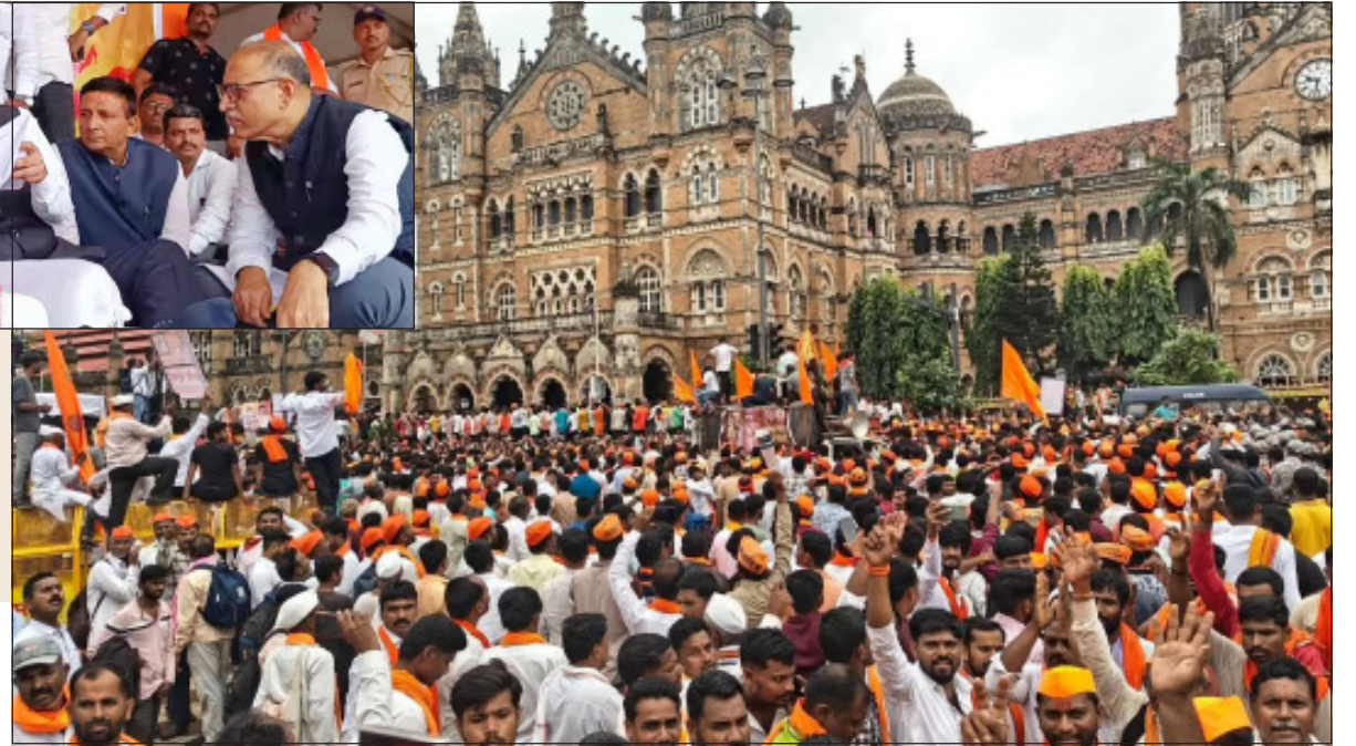
मराठा आंदोलकांनी आज सीएटी स्थानकासमोरी रस्त्यावर मांडला ठिय्या मारला.