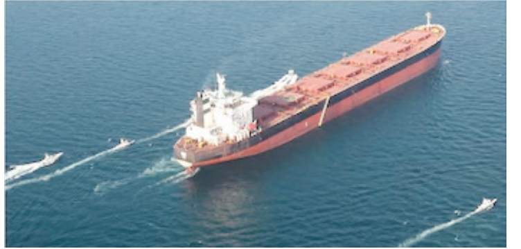
यावर इराणच्या बाजूने कोणतेही स्पष्टीकरण दिले गेले नाही, उलट गोळीबार सुरूच ठेवण्यात आला. यामुळे भारतीय टँकरला आपला मार्ग बदलावा लागला.

भारताच्या परराष्ट्र मंत्रालयाने शनिवारी भारतात नैनात असलेल्या इराणी राजदूतांना बोलावून या घटनेबाबत औपचारिक निषेध नोंदवला. यापूर्वी, इराणने होर्मुझची सामुद्रधुनी बंद करण्याचा आपला इरादा जाहीर केला होता. इराणने आरोप केला होता की अमेरिका शस्त्रसंधी कराराचे उल्लंघन करत आहे; तथापि, अमेरिकेने २४ तासांच्या आत आपला निषेध मागे घेतला.