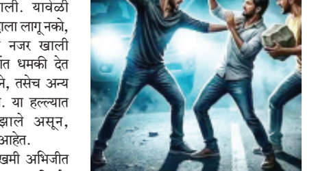
विटा पोलीस ठाण्याच्या हद्दीत घडल्याने पोलिसांनी तातडीने गुन्हा दाखल करून आरोपींचा शोध सुरू केला आहे. या घटनेमुळे शहरात भीतीचे वातावरण निर्माण झाले असून, नागरिकांमध्ये संताप व्यक्त केला जात आहे.