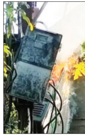
अनेकदा देवुन देखील विज वितरण

वाई तालुक्याच्या पश्चिम भागात डॉगर दर्यात वसलेले अंदाजे दिड हजार लोकवस्तीचे कुसगाव हे गाव आहे. या गावाच्या भरवस्तीत मध्यभागी गावाला विज पुरवठा करण्यासाठी विज वितरण कंपनीने गेल्या कित्येक वर्षां पूर्वी डिपी बसवलेली आहे. याला आधार म्हणून बसवलेले लोखंडी खांब हे सडलेले आहेत या गावात मोठे वायू वादळ आल्यास हे कुचकमी ठरलेले लोखंडी खांब डिपीसह कुठल्याही क्षणी जमीन दोस्त होऊन कधीच न भरून येणारी मोठी दुर्घटना होऊ शकते. त्यासाठी गावात भिषण दुर्घटना होऊन माणसांचे मुद्दे पडू नयेत म्हणून ग्रामस्थांनी एकत्रीत येवून शेकडो समस्यांच्या सहा्यांचे निवेदन तयार करून