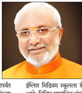
श्री स्वामी समर्थ