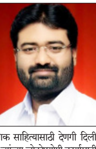
श्री स्वामी समर्थ