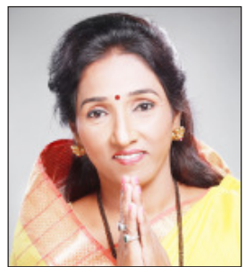
संघटनेमध्ये कधी कधी काही निष्ठा आणल्याचा पट्टीतल असे नाही. काही व्यक्तींशी विश्वासिभ्रता असू शकते. परंतु अशा वेळी अस्वस्थ, शिस्त आणि संघटनेविषयी भावनांवर जपणे आवश्यक असते. मतभेद असतील तर ते योग्य व्यासपीठावर, योग्य भाषणे आणि योग्य पद्धतीने मांडले पाहिजेत. सार्वजनिक ठिकाणी किंवा मनात राग ठेवणे यामुळे संघटनेचा कमकुवत होत.

संघटनेत कार्यकर्त्यांचा सर्वात मोठा गुण आहे. विविध स्वभावान्या, विविध जातीच्या लोकांना एकत्र आणून सर्वांना सोबत घेऊन चालणे हीच खरी कार्यकर्त्यांची ओळख असते. प्रत्येकाची सुसंवाद देवणे, सर्वांचे मत एकणे, मतभेद असले तरी मनभेद होऊ न देणे, आणि योग्य वेळी योग्य नियंत्रण घेणे हीच संघटनेचा ताकद असते.