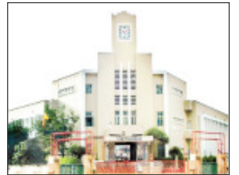
अधिनियम १९७५ मधील कलम २१ अन्वये संबंधितांवर कायदेशीर कारवाई करण्यात येणार असल्याचा इशागही पालिका प्रशासनाने दिला आहे. हे आवाहन केवळ अतिधोकादायक व अतिविस्तारित वृक्षांसाठी लागू असून, नागरिकांनी अनावश्यक वृक्षतोड टाळावी, असेही प्रशासनाने स्पष्ट केले आहे.

दरम्यान, विनापरवाना वृक्षतोड केल्यास 'झाडांचे संरक्षण व जतन