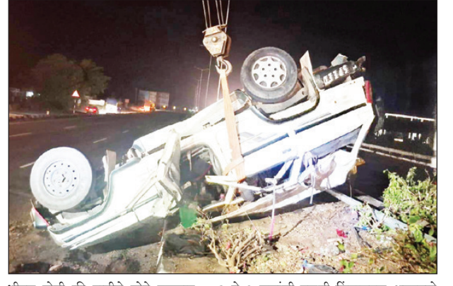
भीषण होती ती गाडीचे मोठे नुकसान झाले आहे.

जेजुरी येथे खंडोबाचे देवदर्शन उरकून आपल्या गावी सांगलीकडे परतणाऱ्या भाविकांच्या गाडीला सातारा-पुणे हायवेवर सुरुर (ता. वई) गावच्या हद्दीत भीषण अपघात झाला. बोल्लेरो गाडी महामार्गावरील विड्यावडला जोरात धडकल्याने हा अपघात घडला असून, यामध्ये २ ते ३ जण गंभीर जखमी झाले आहेत. हा अपघात दि. ७ जून रोजी रात्री ७:४५ वाजण्याच्या सुमारास हॉटेल साई पार्क इनच्या समोर झाला.